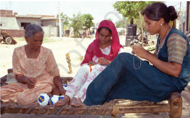
लुधियाना के एक घर में एक बड़ी बहुराष्ट्रीय कंपनी के लिए फुटबाल-निर्माण का चित्र

बहुराष्ट्रीय कंपनियाँ एक अन्य तरीके से उत्पादन नियंत्रित करती हैं। विकसित देशों की बड़ी बहुराष्ट्रीय कंपनियाँ छोटे उत्पादकों को उत्पादन का ऑर्डर देती हैं। वस्त्र, जूते-चप्पल एवं खेल के सामान जैसे उद्योग हैं, जहाँ विश्वभर में बड़ी संख्या में