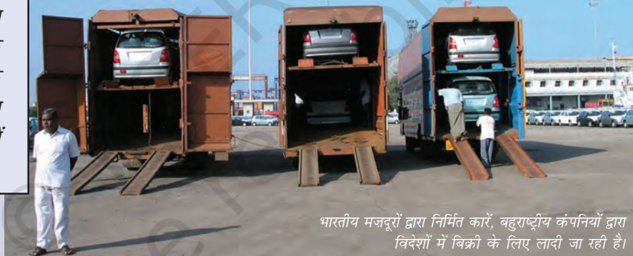
भारतीय मजदूरों द्वारा निर्मित कारें, बहुराष्ट्रीय कंपनियों द्वारा विदेशों में बिक्री के लिए लादी जा रही हैं।