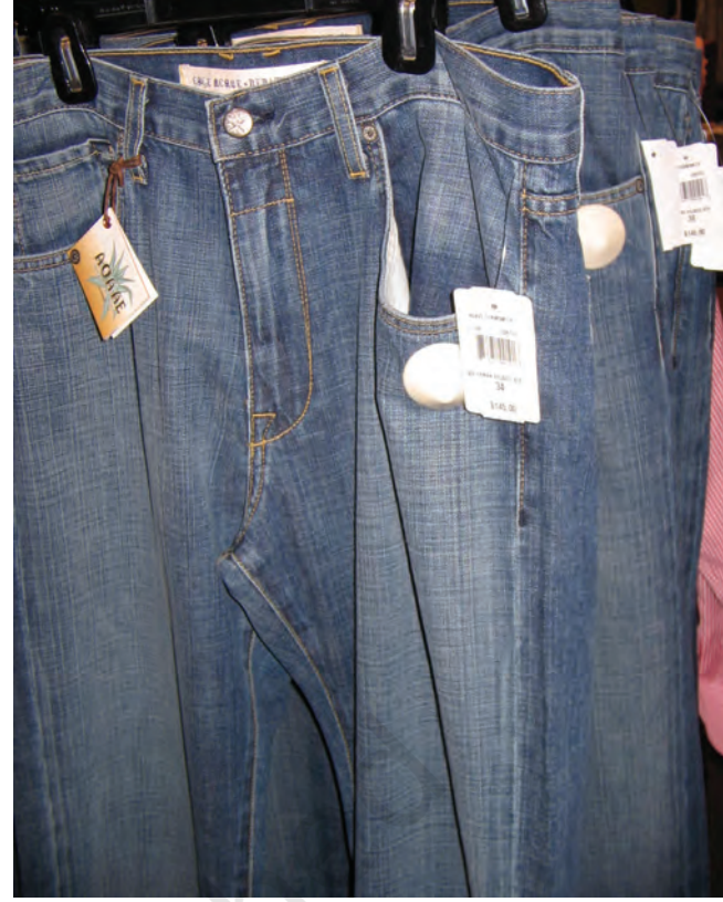
विकासशील देशों में उत्पादित जीन्स अमेरिका में 6500 रु. में बेची जा रही हैं।

छोटे उत्पादकों द्वारा उत्पादन किया जाता है। बहुराष्ट्रीय कंपनियों को इन उत्पादों की आपूर्ति की जाती है। फिर इन्हें अपने ब्राण्ड नाम से ग्राहकों को बेचती हैं। इन बड़ी कंपनियों में दूरस्थ उत्पादकों के मूल्य, गुणवत्ता, आपूर्ति और श्रम-शतों का निर्धारण करने की प्रचण्ड क्षमता होती है।