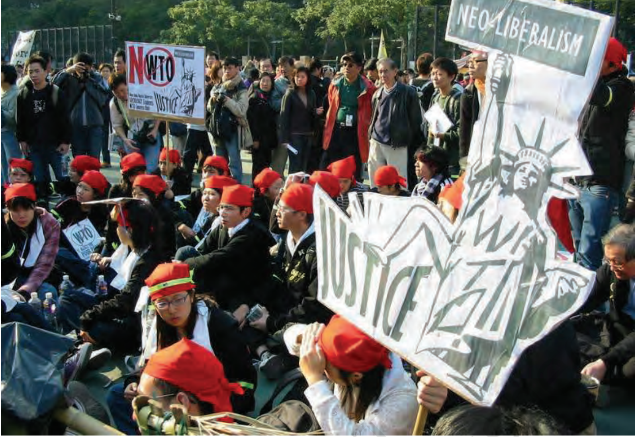
हांगकांग में डब्लू.टी.ओ. के खिलाफ प्रदर्शन-2005